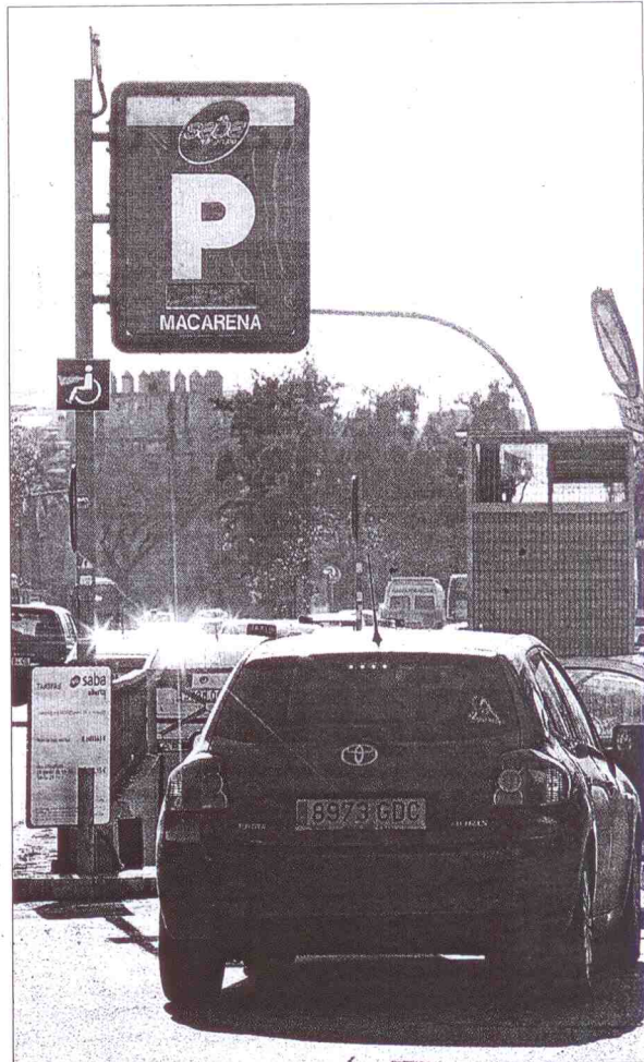
La falta de aparcamiento es una de las principales inquietudes

Estos mecanismos son la reducción de gastos en general –como luz, agua y teléfono– (32,7 por ciento), ocio (26,9), consumo de combustible (24,1), compras (16,7) y la apuesta por marcas blancas en las grandes superficies comerciales (11,9).