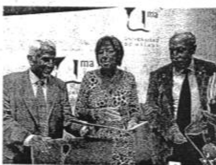
Los docentes universitarios reciben una calificación de notable.